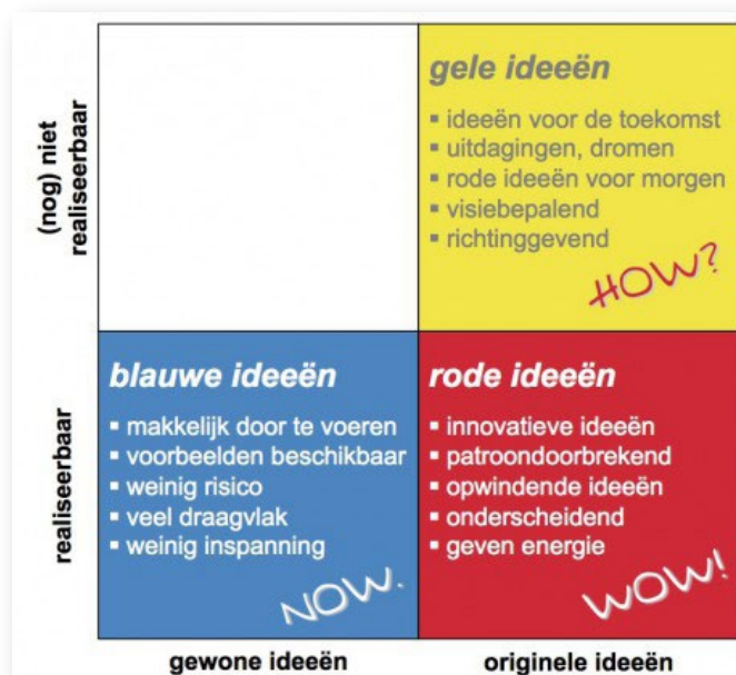
Figuur 2.1 COCD-box.

intersectorale samenwerking en personele mobiliteit te bevorderen. In de derde sessie is gesproken over de rol van sectorfondsen en andere externe partijen wanneer het gaat om het stimuleren van intersectorale samenwerking en personele mobiliteit in het hoger onderwijs. Elke sessie had als doel ideeën te verzamelen om intersectorale samenwerking en personele mobiliteit te bevorderen. De sessies waren zodanig opgezet dat de deelnemers werden gestimuleerd om ‘out of the box’ te denken en zich te richten op mogelijkheden. Daartoe werd – gebaseerd op de COCD-box (Raison, 1997; zie figuur 2.1) – een indeling in ‘blauwe’, ‘rode’ en ‘gele’ ideeën gehanteerd. ‘Blauwe’ ideeën zijn in deze benadering ideeën die gemakkelijk kunnen worden gerealiseerd, ‘rode’ ideeën opties waarvoor meer moeite moet worden gedaan en ‘gele’ ideeën creatieve ideeën die op dit moment nog niet mogelijk zijn, maar die op de langere termijn wel realiseerbaar zouden kunnen zijn. Na afloop van de sessies zijn per sessie enkele ideeën plenair besproken en uitgediept 2 .